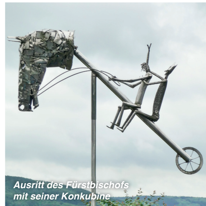
Ausritt des Fürstbischofs mit seiner Konkubine

Zum besseren Verständnis noch ein paar Fakten über den Künstler: aus seinem Gesamtwerk ist raumbedingt nur eine kleine Auswahl zu sehen. Bei allen Sitzmöbeln handelt es sich um vom Künstler entwickelte und selbst hergestellte